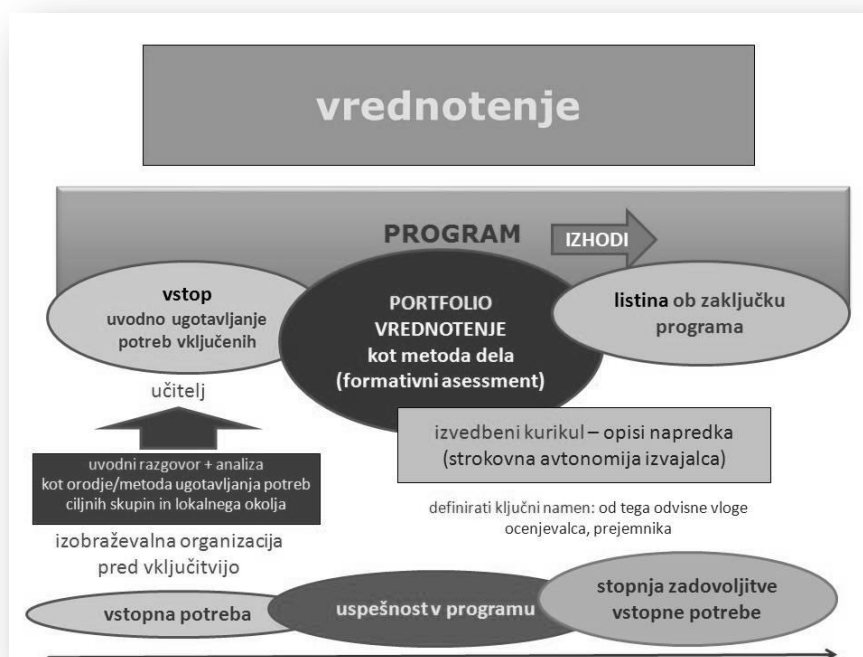
Slika: Elementi procesa vrednotenja temeljnih zmožnosti v okviru izobraževalnega programa (model)

Pri izvajanju postopkov vrednotenja imajo pomembno vlogo izobraževalne organizacije, izvajalke programov za ranljive skupine odraslih, pa tudi učitelji. Njihova nova vloga jih obvezuje, da skozi izvajanje programa skupaj z udeleženci oblikujejo osebno mapo učnih dosežkov (portfolijo), ki bo omogočala zunanje vrednotenje posameznikov temeljnih zmožnosti. Za ranljive skupine je pomembno, da jim izobraževalna organizacija in učitelji pomagajo in svetujejo pri morebitnem zunanjem vrednotenju pridobljenih znanj tudi po zaključku programa.