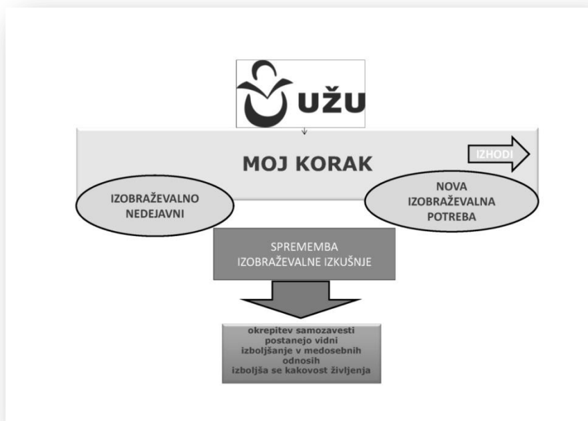
Slika: Najbolj izraziti učinki programa UŽU-MK

Učitelji menijo, da udeleženci v programu UŽU-MK močno utrdijo temeljne spretnosti in znanja, predvsem izpostavljajo socialne spretnosti in medosebne odnose. Pri posebnih znanjih učitelji izpostavljajo pravila vedenja v različnih formalnih situacijah, kakovostno preživljanje prostega časa in varovanje zdravja.