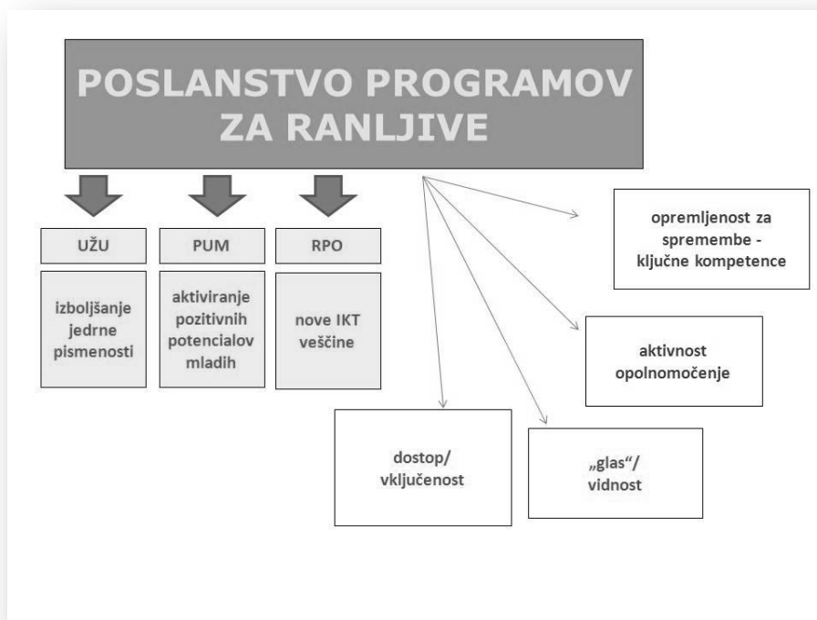
Slika: Poslanstvo programov za ranljive skupine odraslih

Raziskovalci področja so med letoma 2001 in 2006 izpeljali manjše raziskave, ki so pokazale, kakšne so izobraževalne potrebe posameznih ciljnih skupin ter njihove možnosti in priložnosti za izobraževanje v okolju, kjer živijo. Ob programu za ciljno skupino je bil oblikovan tudi program usposabljanja strokovnih delavcev, t. i. Temeljno usposabljanje učiteljev za izvajanje programov UŽU, ki ga vsa ta leta vodi in izvaja Andragoški center Slovenije.