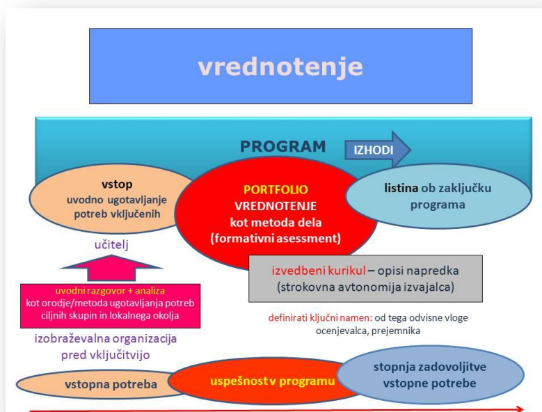
Slika: Elementi procesa vrednotenja temeljnih zmožnosti v okviru izobraževalnega programa (model)

Pri izvajanju postopkov vrednotenja imajo pomembno vlogo izobraževalne organizacije, izvajalke programov za ranljive skupine odraslih, pa tudi učitelji. Njihova nova vloga jih obvezuje, da skozi izvajanje programa skupaj z udeleženci oblikujejo osebno mapo učnih dosežkov (portfolijo), ki bo omogočala zunanje vrednotenje posameznikov temeljnih zmožnosti. Za ranljive skupine je pomembno, da jim izobraževalna organizacija in učitelji pomagajo in svetujejo pri morebitnem zunanjem vrednotenju pridobljenih znanj tudi po zaključku programa.