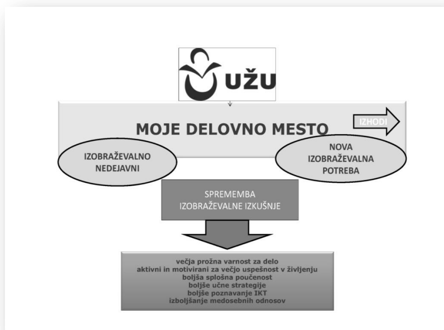
Slika: Najbolj izraziti učinki programa UŽU-MDM