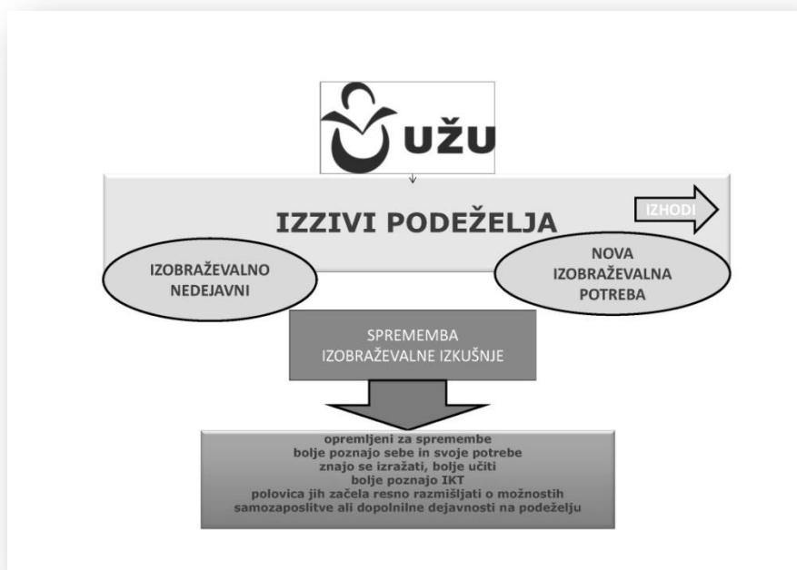
Slika: Najbolj izraziti učinki programa UŽU-IP