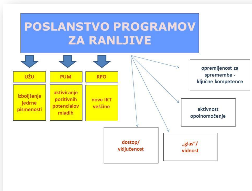
Slika: Poslanstvo programov za ranljive skupine odraslih

Raziskovalci področja so med letoma 2001 in 2006 izpeljali manjše raziskave, ki so pokazale, kakšne so izobraževalne potrebe posameznih ciljnih skupin ter njihove možnosti in priložnosti za izobraževanje v okolju, kjer živijo. Ob programu za ciljno skupino so bili vedno oblikovani tudi programi usposabljanja strokovnih delavcev, t. i. temeljna usposabljanja učiteljev za izvajanje programov, ki jih je vsa ta leta vodil in izvajal Andragoški center Slovenije. Na osnovi teh izkušenj je oblikovan tudi ta program.