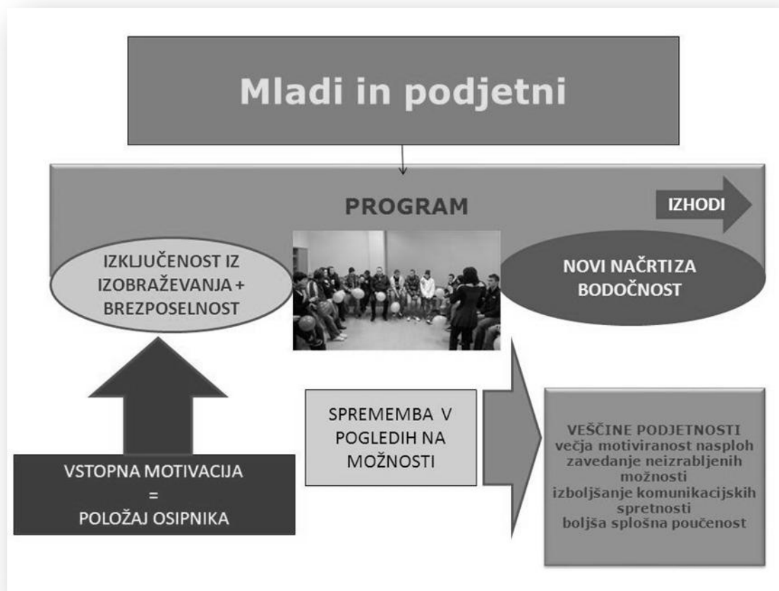
Slika: Model izobraževalnih programov za ranljive skupine, prilagojen za program Mladi in podjetni

Za vključitev ustreznih pripadnikov ranljive skupine v program je v slovenskem modelu programov za ranljive skupine ključna t.i. vstopna motivacija, ki izhaja iz aktualne potrebe posameznika. Program Mladi in podjetni je oblikovan tako, da prek pozitivne izobraževalne izkušnje in pridobljenih novih znanj in zmožnosti pri mladih spreminja stanje 'naučene nemoči' in pasivnosti, ter utrjuje prepričanje in vedenje, ki mlade spodbuja k večjemu nadzoru nad potekom življenja, predvsem pa naj poveča motivacijo za reševanje problemov povezanih s socialno izključenostjo in brezposelnostjo. Pri mladih se postopoma skozi program izboljša samopodoba, pride pa tudi do jasnejšega zavedanja o pomenu izoblikovane delovne samopodobe posameznika. Udeleženci naj skozi skupne dejavnosti postopno »spoznajo, da zmorejo«. Ob tem mladi pridobivajo tudi druga znanja, ki so uporabna v vsakdanjem življenju. Posameznikova spoznanja in opolnomočenje prispevajo k poglobitvi ali celo k drugim novim izobraževalnim potrebam, kar razumemo kot kazalnik zanesljive uspešnosti programa. Tudi najšibkejši vključeni posameznik bi moral dobiti izkušnjo, da lahko črpa iz lastnih ustvarjalnih zmožnosti ter da je njegov prispevek družbi pomemben, zaželen.