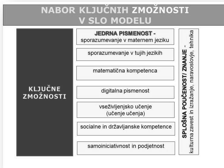
Slika: Izbor temeljnih zmožnosti v programih za razvoj pismenosti

Izbor temeljnih zmožnosti izhaja iz dvajsetletnih izkušenj slovenskih strokovnjakov pri izvajanju programov. Izbranih in v model umeščenih je osem ključnih zmožnosti: