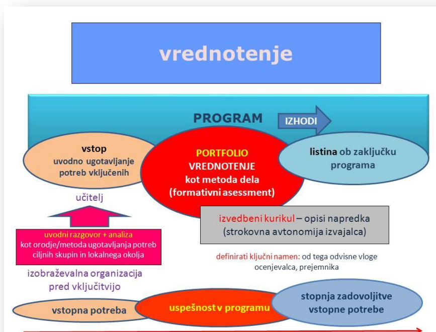
Slika: Elementi procesa vrednotenja temeljnih zmožnosti v okviru izobraževalnega programa (model)

Pri izvajanju postopkov vrednotenja imajo pomembno vlogo izobraževalne organizacije, izvajalke programov za ranljive skupine odraslih, pa tudi učitelji. Njihova nova vloga jih obvezuje, da skozi izvajanje programa skupaj z udeleženci oblikujejo osebno mapo učnih dosežkov (portfolijo), ki bo omogočala zunanje vrednotenje posameznikov temeljnih zmožnosti. Za ranljive skupine je pomembno, da jim izobraževalna organizacija in učitelji pomagajo in svetujejo pri morebitnem zunanjem vrednotenju pridobljenih znanj tudi po zaključku programa.